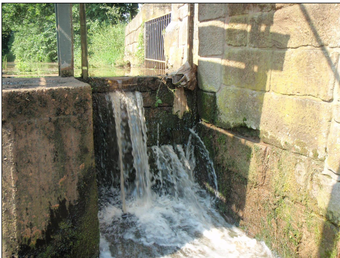
Stavidlo štěrkové propusti. Ocelové vodící prvky značně narušeny korozí. Ocelové ovládací prvky možné repasovat. Nutná výměna dřevěných prvků a ocelových kotvicích prvků. Původní část LB jezové zdi v profilu lávky je ve špatném stavu, spárami prosakuje voda ze zdrže.