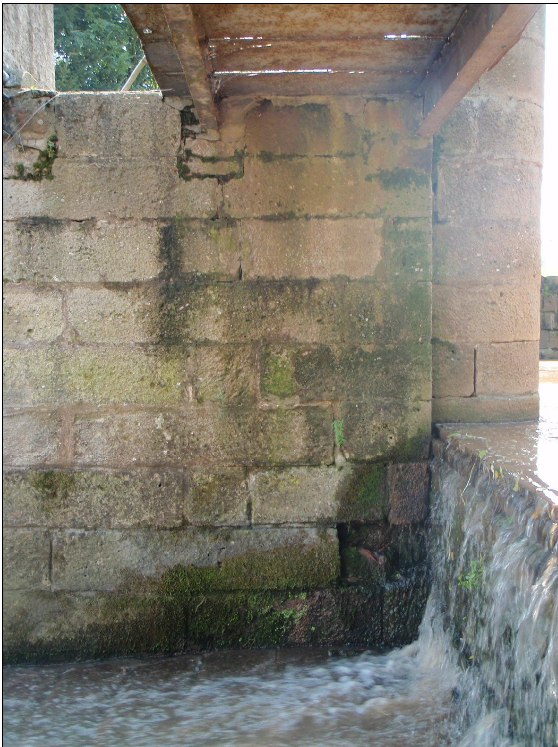
Kotvení lávky na středovém pilíři, levé pole.