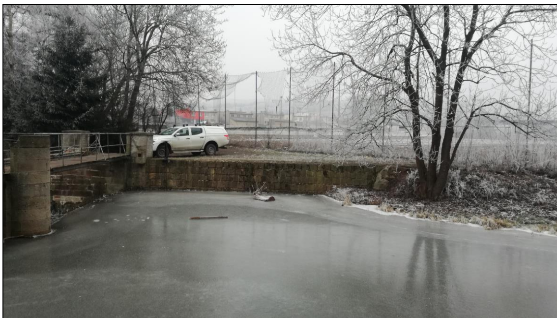
PB jezová zeď v nadjezí.