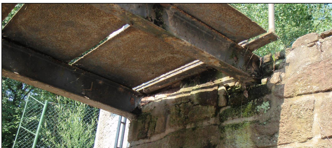
Kotvení lávky u levé podpory.