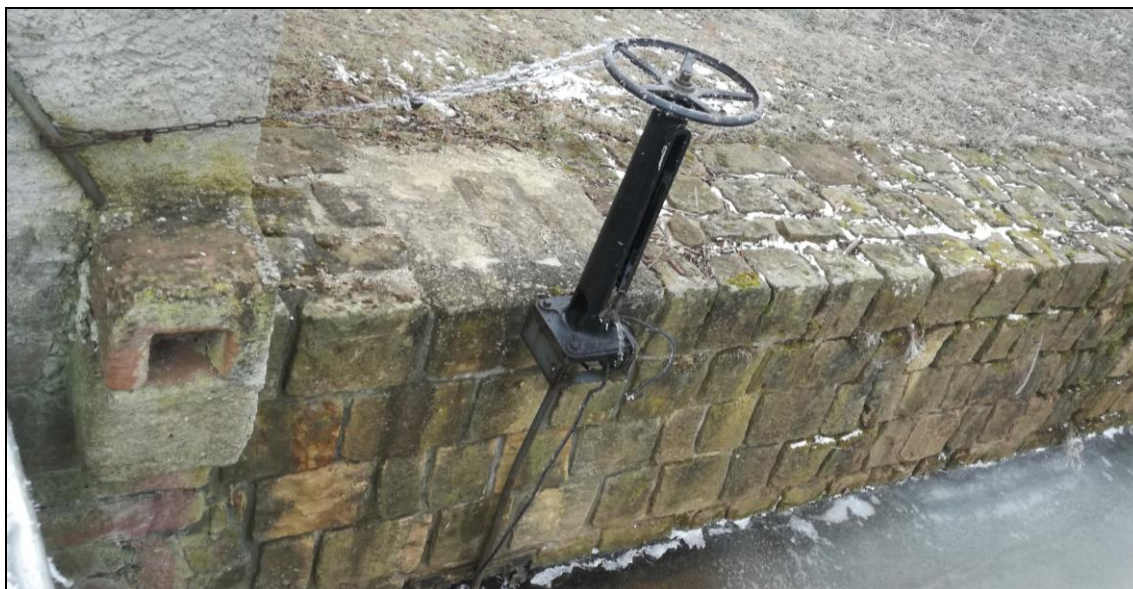
kanálové šoupátko do náhonu, PB jezová zed'.