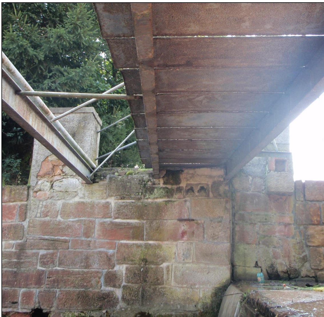
Kotvení lávky u pravé podpory.