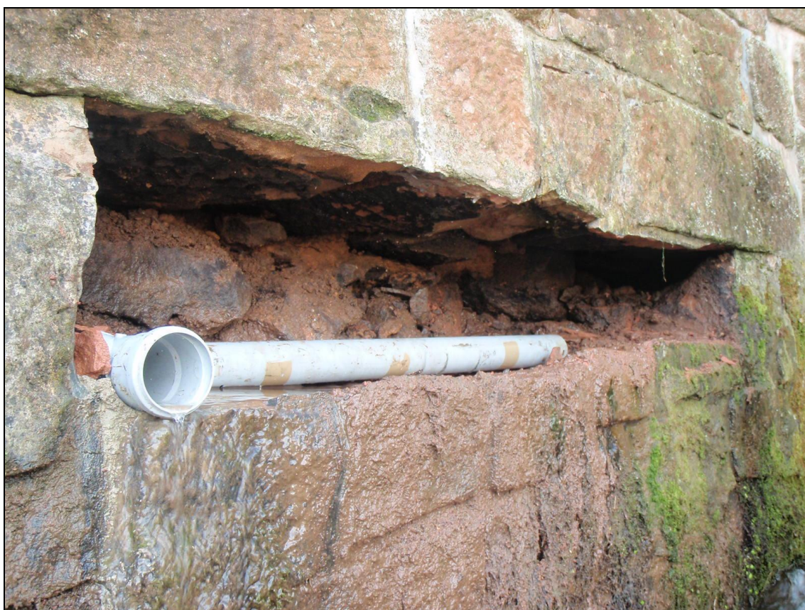
Svedení průsaků v původní konstrukci jezové zdi do drenáže. Průsak z nadjezí. Původní pískovcové kvádry se rozpadly.