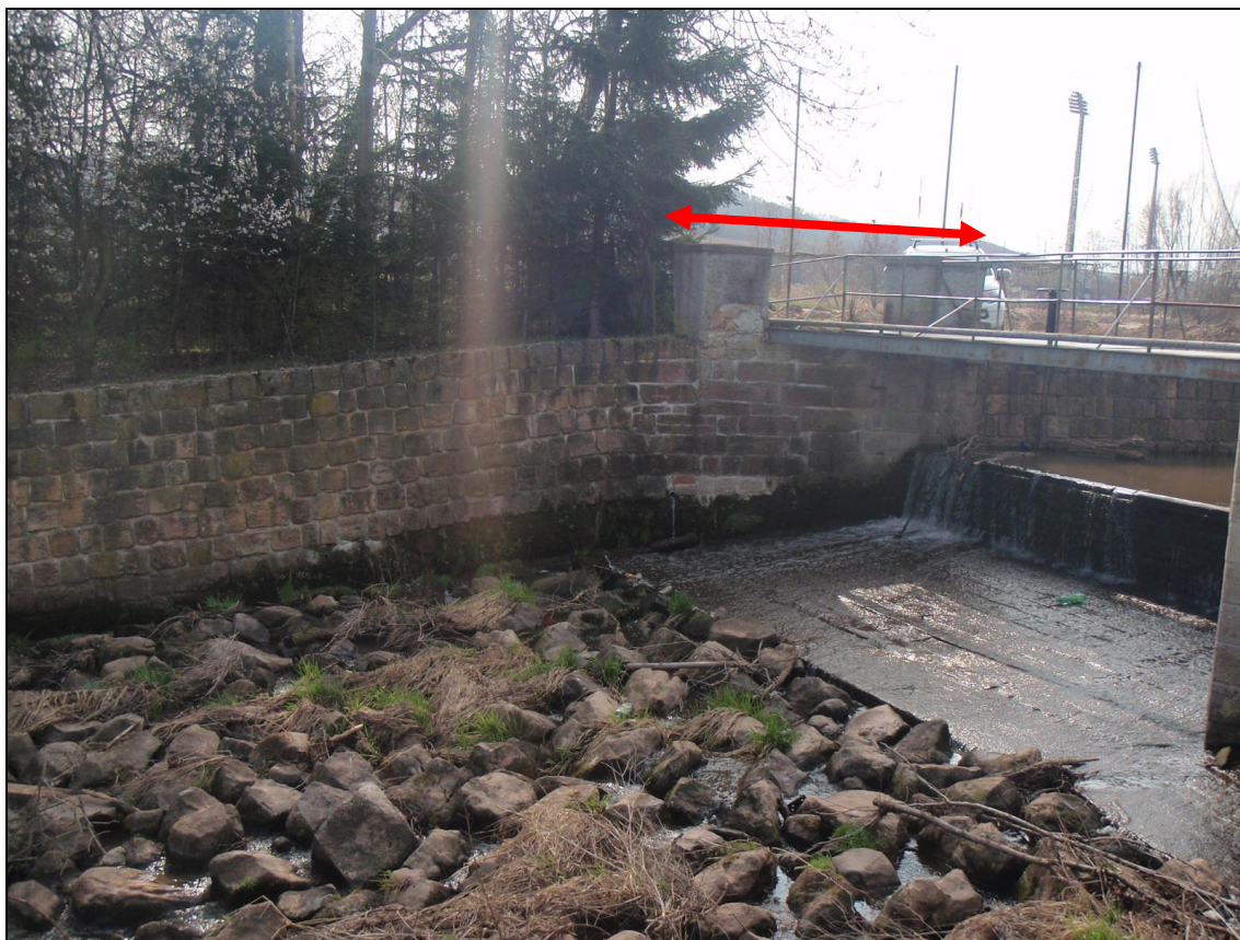
Původní část PB jezové zdi v profilu lávky.