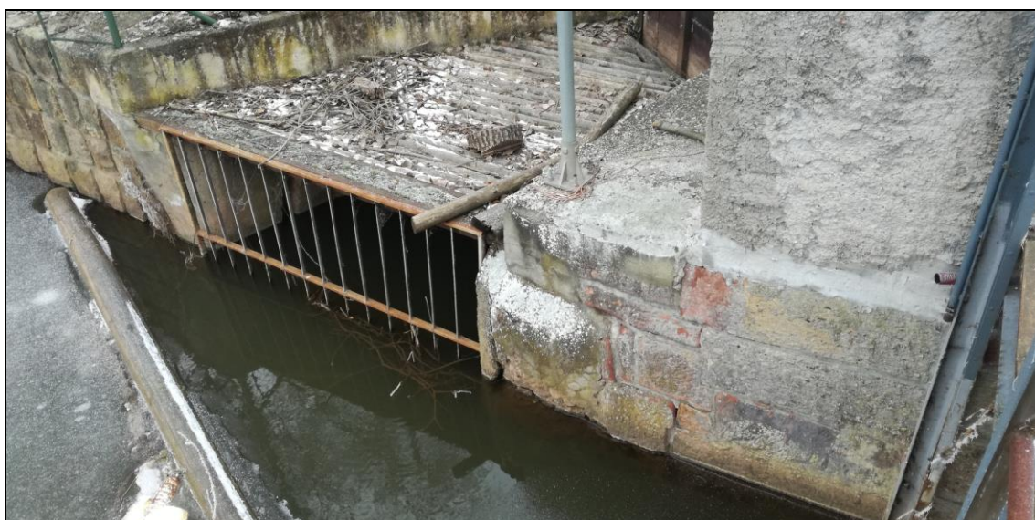
Nátok do MVE, LB jezová zed'.