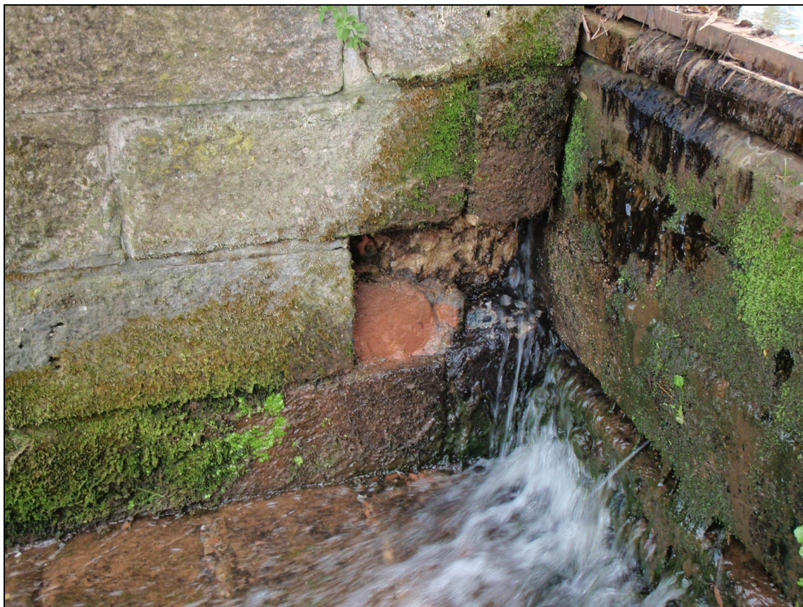
Poškozený pískovcový kvádr ve středovém pilíři. Oprava není za běžného provozu možná.