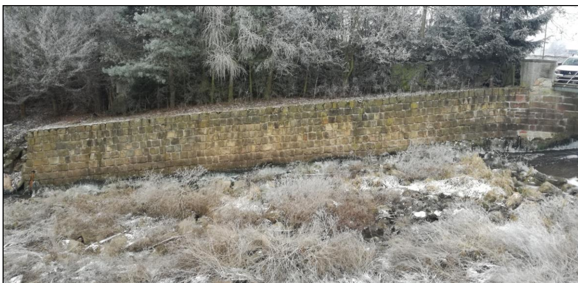
PB jezová zed' v podjezí.