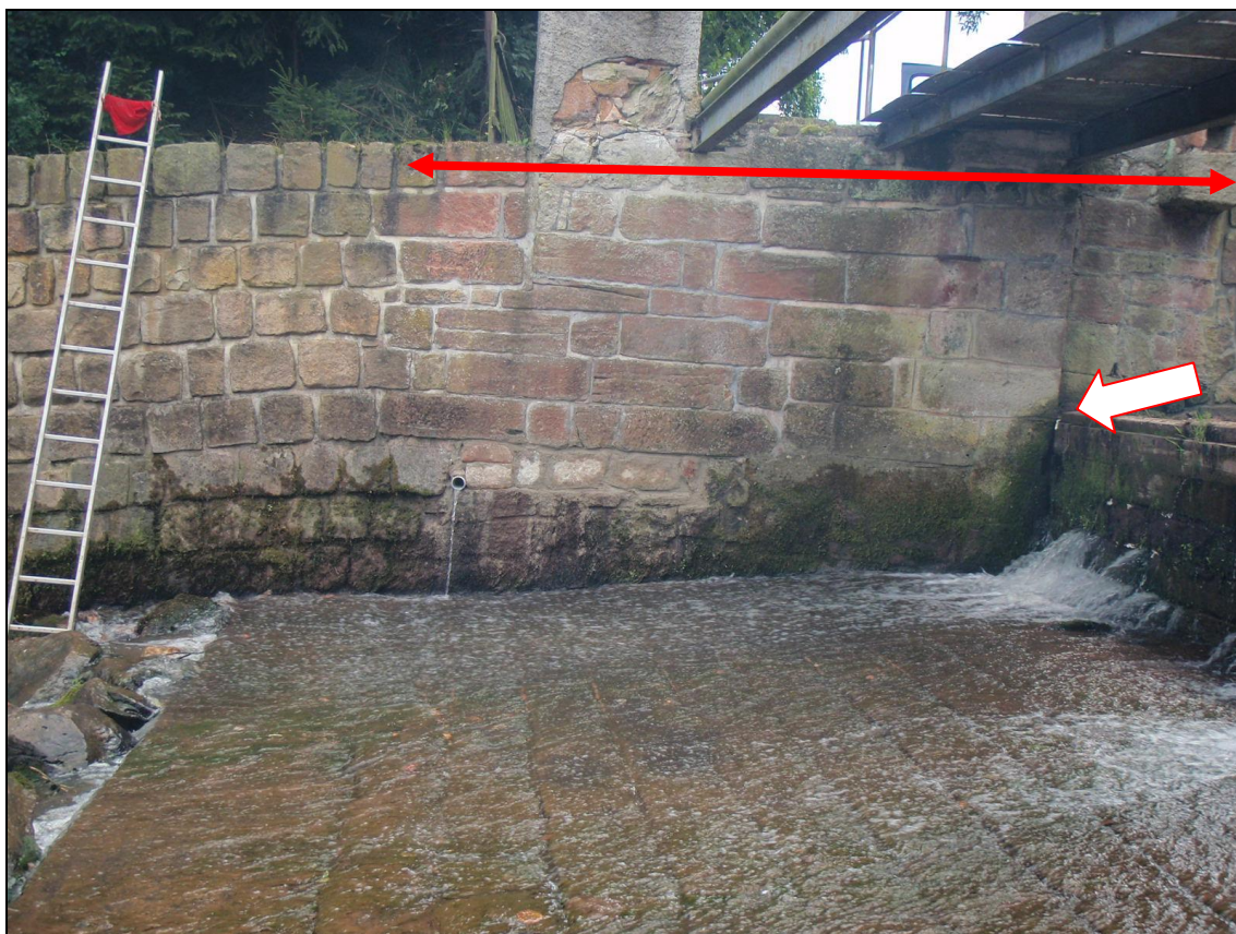
Původní část PB jezové zdi v profilu lávky. Šipka značí poruchu v lomu zdi, o který je opřeno hrazení. Touto cestou prosakuje za konstrukci jezové zdi voda ze zdrže.