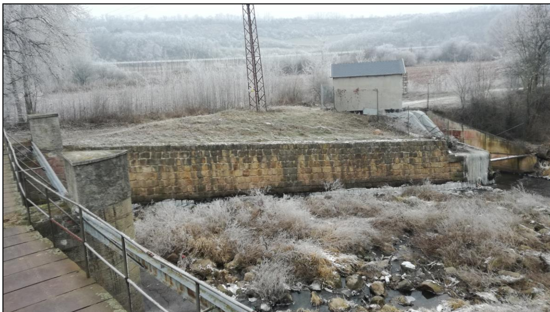
LB jezová zeď v podjezí.